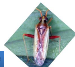
アカスジカスミカメ